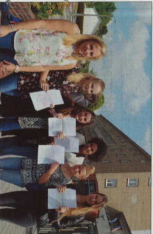
La dissertation a découragé certains élèves qui ont opté pour l'explication de texte